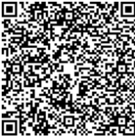
无锡职业技术学院“企业码”