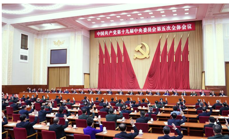
中国共产党第十九届中央委员会第五次全体会议，于2020年10月26日至29日在北京举行。中央政治局主持会议。

全会充分肯定党的十九届四中全会以来中央政治局的工作。一致认为，一年来，中央政治局高举中国特色社会主义伟大旗帜，坚持以马克思列宁主义、毛泽东思想、邓小平理论、“三个代表”重要思想、科学发展观、习近平新时代中国特色社会主义思想为指导，全面贯彻党的十九大和十九届二中、三中、四中全会精神，增强“四个意识”、坚定“四个自信”、做到“两个维护”，统筹推进“五位一体”总体布局，协调推进“四个全面”战略布局，坚持稳中求进工作总基调，坚持新发展理念，坚定不移推进改革开放，沉着有力应对各种风险挑战，统筹新冠肺炎疫情防控和经济社会发展工作，把人民生命安全和身体健康放在第一位，把握扩大内需这个战略基点，深化供给侧结构性改革，加大宏观政策应对力度，扎实做好“六稳”工作、全面落实“六保”任务，坚决维护国家主权、安全、发展利益，疫情防控工作取得重大战略成果，三大攻坚战扎实推进，经济增长好于预期，人民生活得到有力保障，社会大局保持稳定，中国特色大国外交积极推进，党和国家各项事业取得新的重大成就。